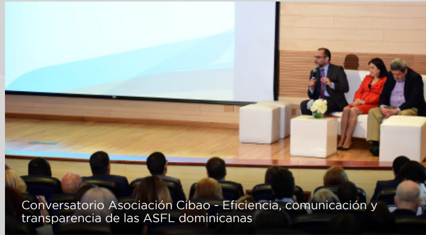
Conversatorio Asociación Cibao - Eficiencia, comunicación y transparencia de las ASFL dominicanas