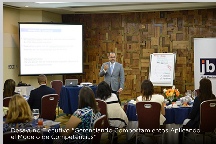
Desayuno Ejecutivo "Gerenciando Comportamientos Aplicando el Modelo de Competencias"

DESAYUNO EJECUTIVO Gerenciando Comportamientos: Aplicando el Modelo de Competencias