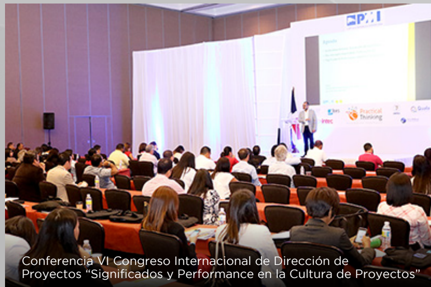
Conferencia VI Congreso Internacional de Dirección de Proyectos "Significados y Performance en la Cultura de Proyectos"